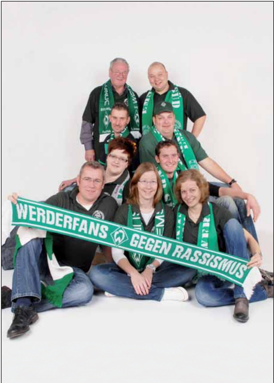
Der aktuelle Vorstand der Werderfreunde!