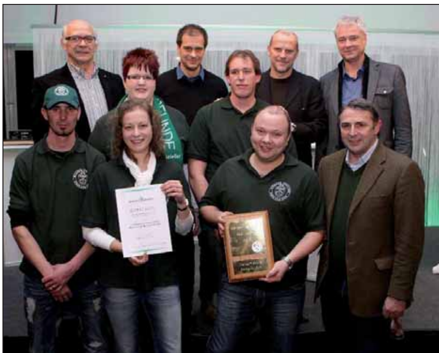
Die Werderfreunde bei der Auszeichnung in Bremen gemeinsam mit Werder Management und Trainer Thomas Schaaf!

Sozialpädagogischen Fachdienst vor Ort. Diese Partnerschaft ist auch Bestandteil des LinaS- Projektes der Stadt Lingen, welches behinderten Menschen ermöglicht am normalen Leben teilzuhaben. Auch regelmäßige Geldspenden, die während einer Saison gesammelt werden, kommen sozialen Einrichtungen zu Gute. So wurde im Jahr 2010 700 Euro für den in Lingen ansässigen Verein AIDS-Hilfe Emsland und im Jahr 2011 3000 EUR für das Christophorus-Werk Lingen gespendet. Die Mitglieder selber sind auch aktiv, sie nahmen auf einer Strecke von 5 Kilometer am Solidaritätslauf „KOMEN - Race for the Cure“ in der Meppener Innenstadt teil. Die Läufer zeigten Solidarität mit den von Brustkrebs betroffenen Frauen und unterstützten die Organisation Susan G. Komen Deutschland bei der Aufklärung über der Heilung von Brustkrebs.